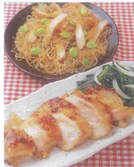
■熱量/804Kcal ■蛋白質/91.0g ■脂質/92.6g