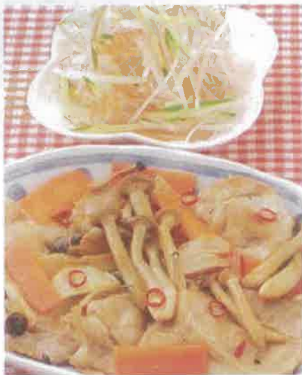
■熱量/235Kcal ■蛋白質/19.7g ■脂質/13.3g