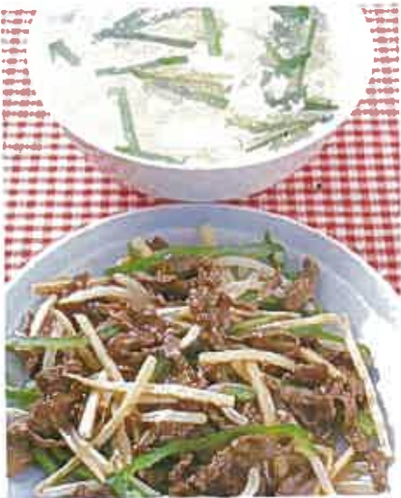
■熱量/391Kcal ■蛋白質/20.7g ■脂質/24.4g