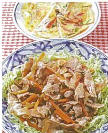
■熱量/407Kcal ■蛋白質/26.5g ■脂質/16.1g